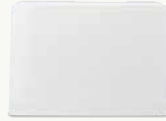
ミシンを守るハードケース