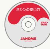
使い方がよくわかる 説明DVD