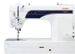
COSTURA 800DB DB針仕様 148,500円(税込)