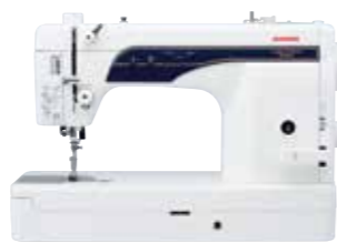
COSTURA 800HX HL針仕様 203,500円(税込)