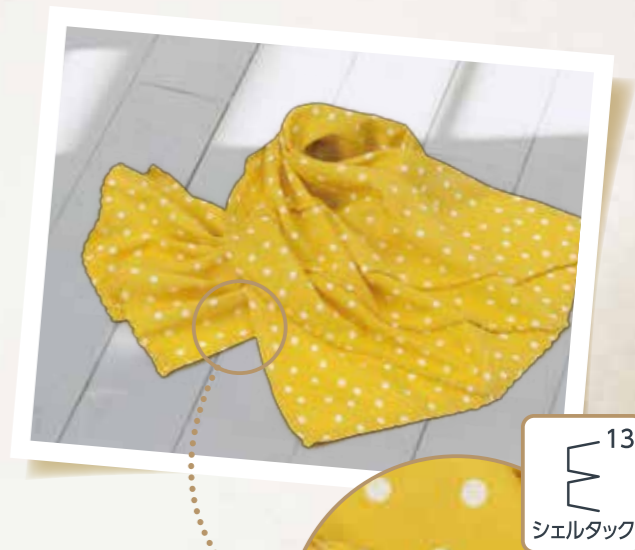
シェルタックでスカーフをおしゃれに。