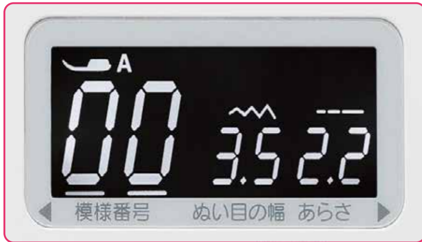
大きく見やすいLCDスクリーン