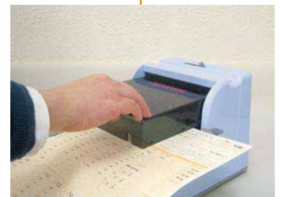
■ 二重印字防止機構付